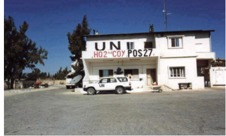
Position 27 / Syrien

Knüpfen Sie Kontakte zu gleichgesinnten Soldaten und deren Familien, um für den Fall von Krisen ein soziales Netz aus Hilfsangeboten und Informationsquellen bereitzuhaben. Neben zivilen Vereinen und sozialen Einrichtungen bieten die Familientage ein gutes Forum neben den aktuellen Informationen die gegenseitige