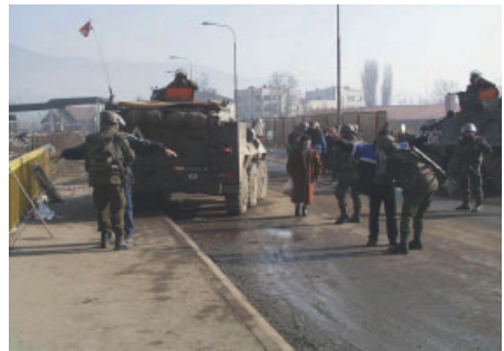
Personen- und Fahrzeugkontrolle

Hinter vielen negativen Überlegungen stehen Ungewissheit, Sorgen und Ängste. Diese sollten akzeptiert und hinterfragt werden. Solche Fragen könnten z.B. lauten: