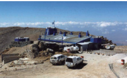
Position Hermon Süd/ Syrien

Nützen Sie jede Gelegenheit für gemeinsame, schöne Erlebnisse. Verbringen Sie einen netten Abend mit dem Partner oder genießen Sie einen erholsamen Ausflug mit der ganzen Familie. Die Erinnerung daran wird Ihnen