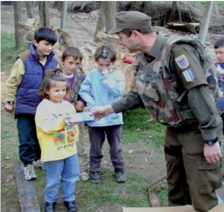
Zivil-militärische Zusammenarbeit (CIMIC) Verteilung von Hilfsgütern

Sprechen Sie auch mit Ihren Kindern regelmäßig und offen über die Trennungssituation. Betonen Sie immer wieder, dass Ihr Partner trotz seiner derzeitigen Abwesenheit ein unverzichtbares und wichtiges Mitglied der Familie ist.