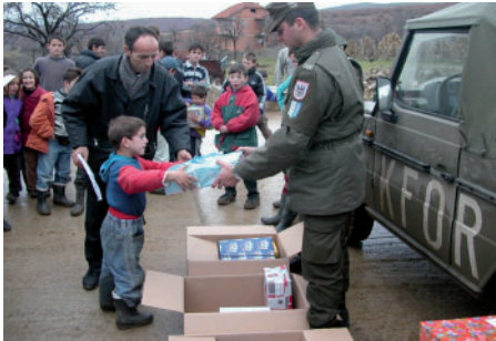
Weihnachtspakete für Familien im Kosovo

Positive Begleiterscheinungen eines Auslandseinsatzes sind: