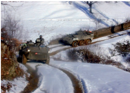
Patrouille im Kosovo

Auch der Zeitpunkt des Abschiednehmens und der Abreise kann sehr belastend sein. Treten jetzt vermehrt Gefühle von Gereiztheit, reduzierte Vertrautheit oder fehlende Intimität bei Ihrem Partner auf, so interpretie-