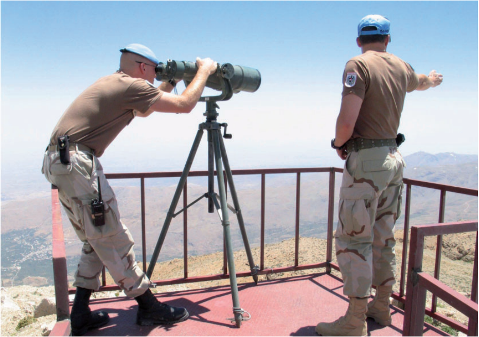
Weite Sicht ins Land vom Mt. Hermon/Syrien