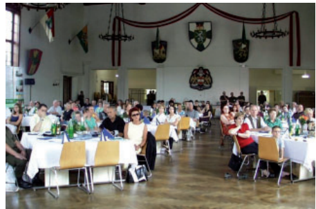
Angehörigeninformation im Rahmen eines Familientages

Mit diesen Familieninformationstagen wollen wir den Angehörigen Einblicke in den „Soldatenalltag“ vermitteln und über das Einsatzgebiet hinsichtlich der militärischen, politischen und wirtschaftlichen Lage informieren.