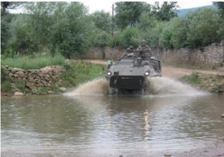
Queren einer Furt mit dem Pandur

mäßige und ausgewogene Ernährung. Pflegen Sie gute Kameradschaft und gestalten Sie Ihre Freizeit möglichst aktiv. Vermeiden Sie übermäßigen Alkoholgenuß und den Konsum von Drogen. Dazu gehören auch illegale Muskelaufbaupräparate und andere verbotene Substanzen. Auch ein übermäßiger Konsum von elektronischen Medien (Internet, Videos, Pornographie etc.) beinhaltet ein nicht zu unterschätzendes Suchtpotential und die Gefahr einer zunehmenden Isolation sowohl im Einsatzraum als auch nach der Heimkehr.