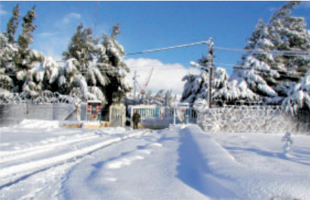
Einfahrt zu Camp Faouar/ Syrien

Diese Ängste können für alle Beteiligten sehr belastend sein.