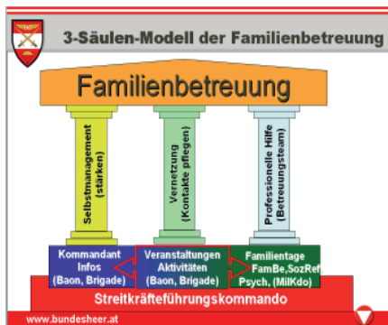
Die Grafik ist im Anhang vergrößert dargestellt (Seite 20)

Auf der Ebene der territorial zuständigen Militärkommanden gibt es Betreuungsteams mit Spezialisten aus den Fachgebieten Truppenbetreuung, Familienbetreuung, Psychologie, Seelsorge, Soziale Betreuung, Berufsberatung, Schuldnerberatung und Rechtsberatung, die bei Bedarf rasch und effizient unterstützen können. Dort sind auch die Kontaktstellen zu verschiedenen zivilen Organisationen, die eine entsprechende professionelle Lösung von Problemen sicherstellen können, angesiedelt.